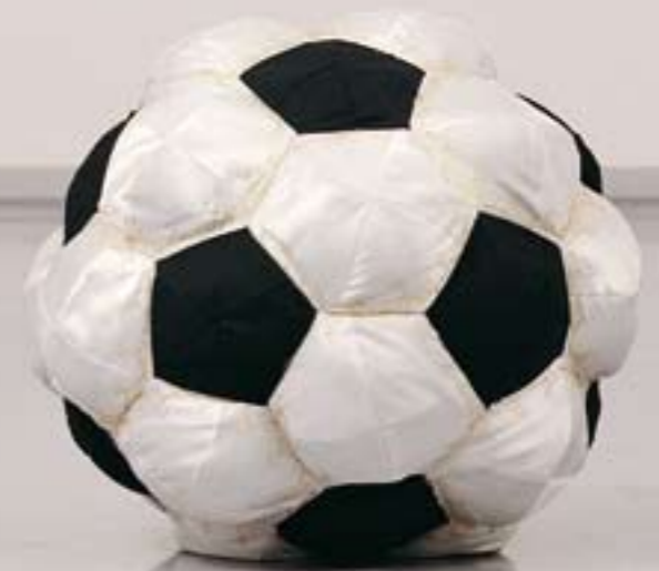
- Sabbath Match Black-and-white skullcaps ( kippot ) and Acrilan Diameter 46 -