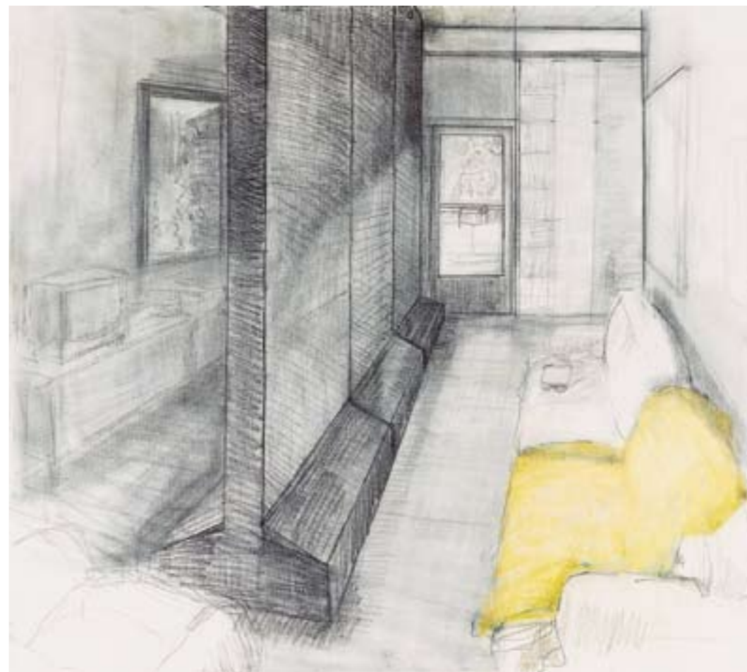
- Untitled (Living Room) Graphite, tempera and varnish on cotton 100×90 -