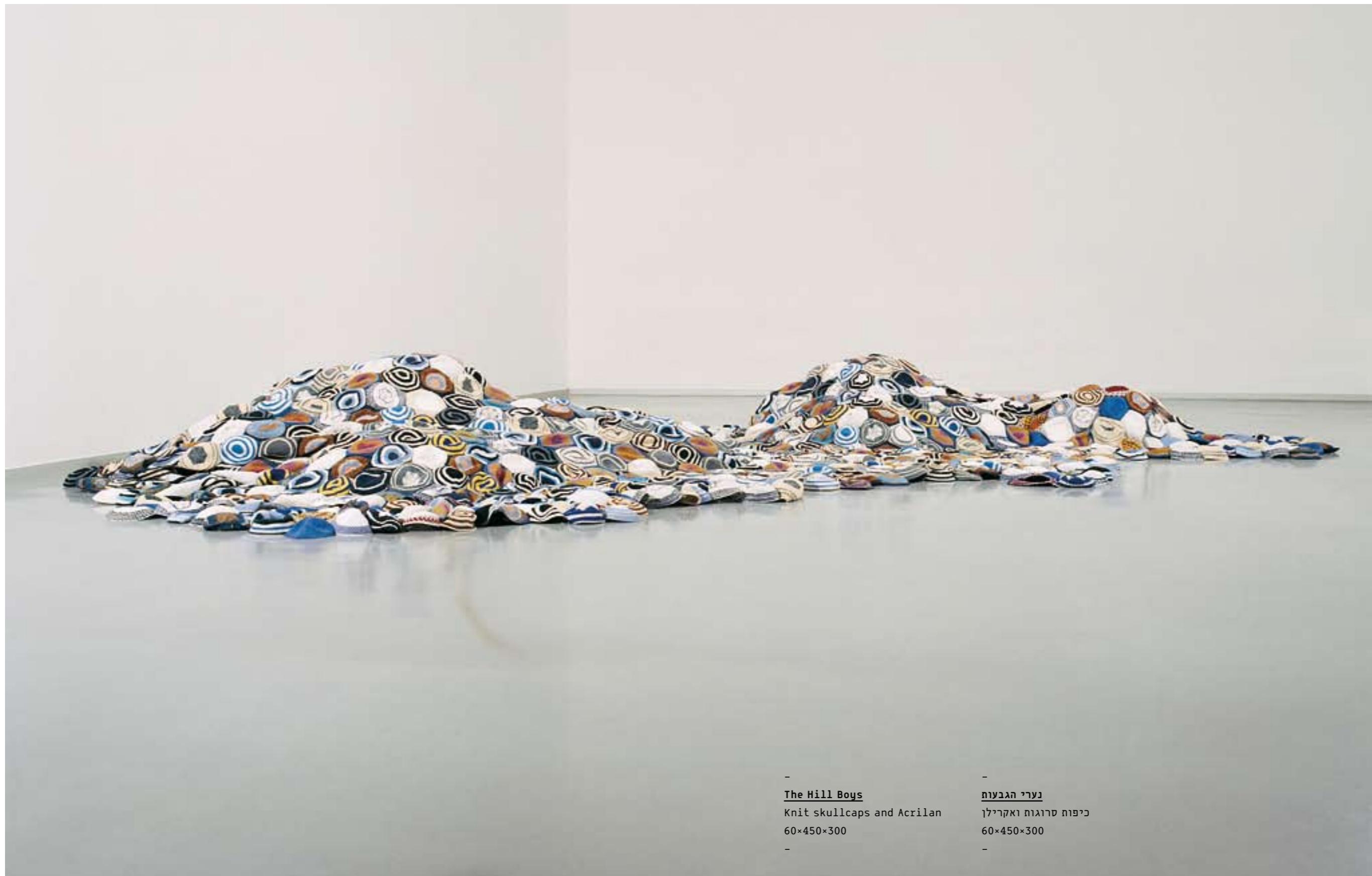
- The Hill Boys Knit skullcaps and Acrilan 60×450×300 -